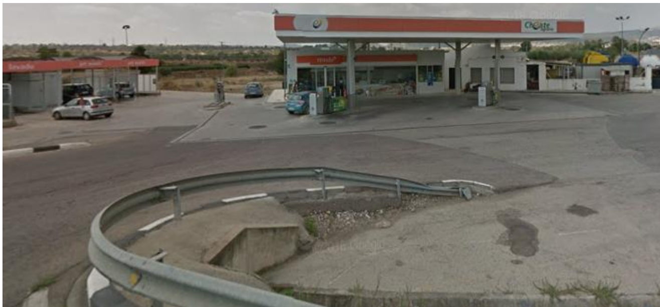
Ctra. Cheste-Valencia CV-378 km 0.4 Cheste - Valencia

Estación de Servicio "Cooperativa Cheste"