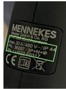
20A/480V - 20A/230V