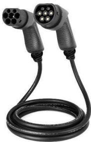
CABLE DE RECARGA